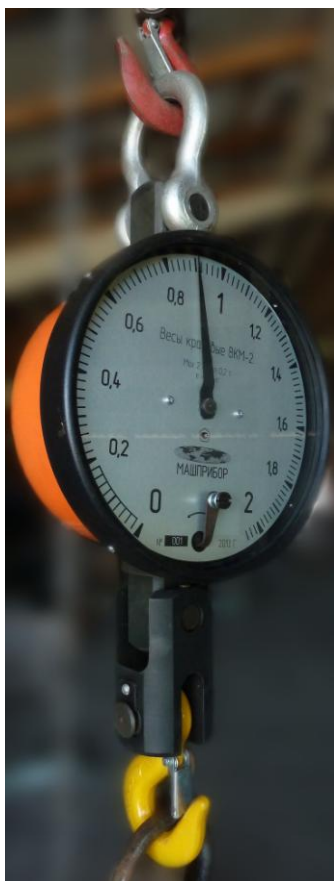
Рисунок 1 – Фотография общего вида весов