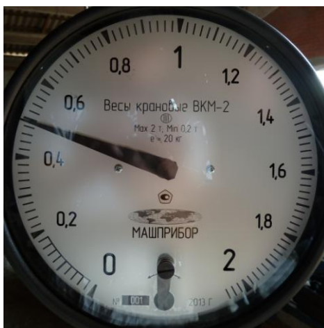
Рисунок 2 – Маркировка весов