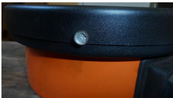
Рисунок 3 – Место пломбировки от несанкционированного доступа