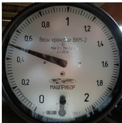
Рисунок 2 – Маркировка весов